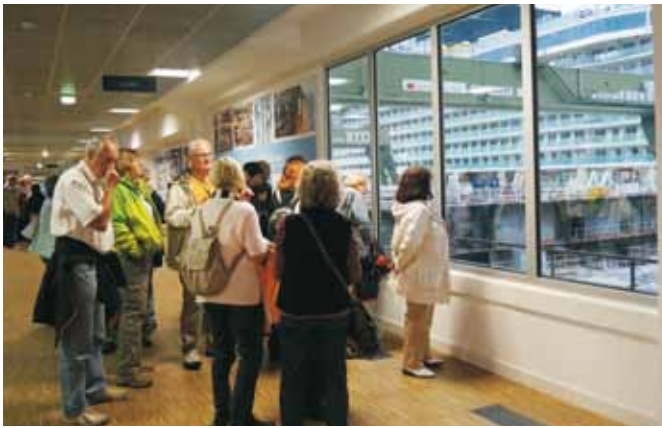
Im Besucherzentrum der Meyer-Werft in Papenburg