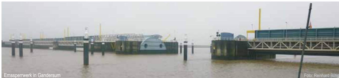
Emssperwerk in Gandersum